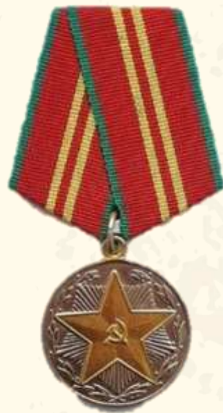
Медаль «За безупречную службу» 2 степени