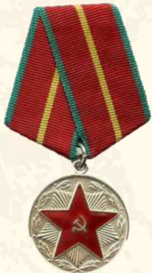
Медаль «За безупречную службу» 1 степени