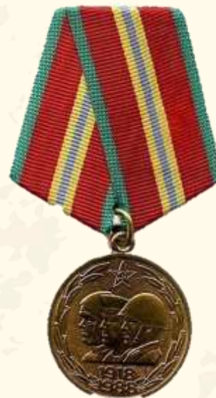
Юбилейная медаль « 70 лет Вооружённых Сил СССР»