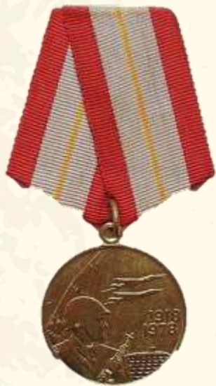
Юбилейная медаль « 60 лет Вооружённых Сил СССР»