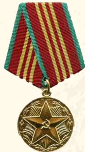
Медаль «За безупречную службу» 3 степени