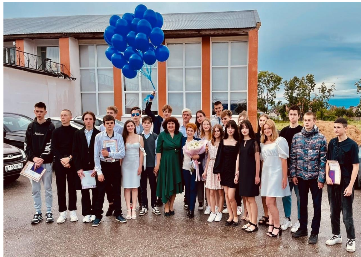
2022 год (выпуск)