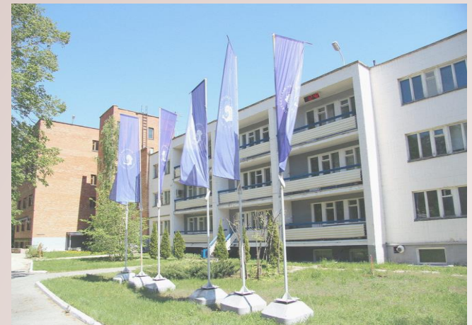
Тольяттинская академия управления (ТАУ)