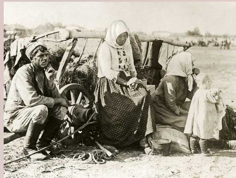
Беженцы от голода в Самарской губернии, 1921 год

Ещё в самом начале голода, в сентябре 1921 года от истощения скончалось 57 человек, из них 18 детей. Американская администрация помощи открыла в селе шесть питательных пунктов на 1855 человек, на одного голодающего в день выделялось 96 г хлеба, 24 г крупы, 96 г масла, 124 г сахара, 132 г картофеля.