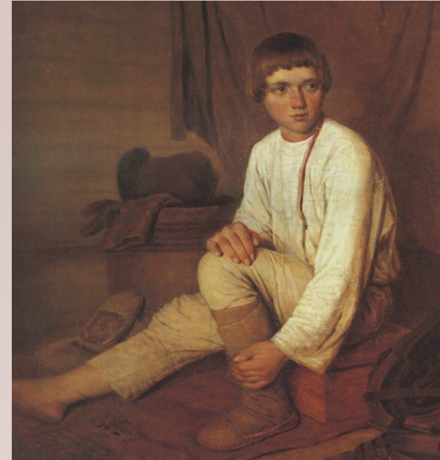
«Крестьянский мальчик, надевающий лапти» (1820)

С 1797 года население Ягодного вошло в удельное ведомство во владение императорского дома. Крестьяне Ягодного арендовали землю в имении, а также отработывали оброк на полевых, лесных и ирригационных работах. В 1830 году подушный оброк был заменён на поземельный сбор. В 1858—1859 годах была отменена личная зависимость крестьян. С 1863 года земли, находившиеся в пользовании крестьянами, были предоставлены им в собственность, при условии обязательного выкупа, который должен был оплачиваться 49 лет. В 1868 году крестьянам Ягодного была выдана уставная грамота.