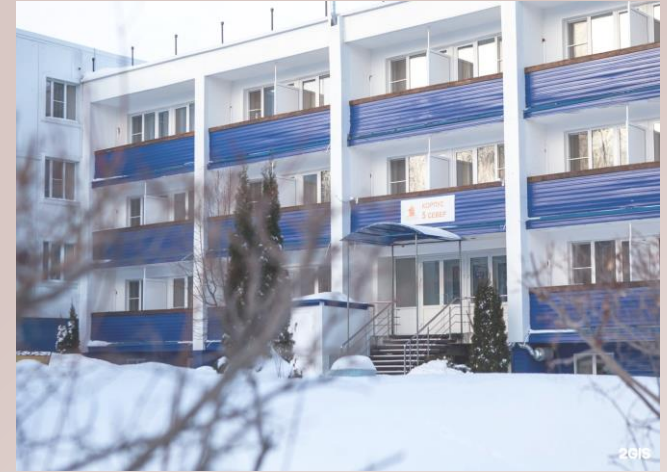
Лагерь «Алые паруса»

На сегодняшний день на территории села в ягодинском лесничестве расположены детские оздоровительные (пионерские) лагеря: «Берёзка», «Спартак», «Электроник», среди них, самый большой бывший всесоюзный пионерский лагерь → ныне санаторий «Алые паруса», на территории которого расположена «Тольяттинская академия управления».